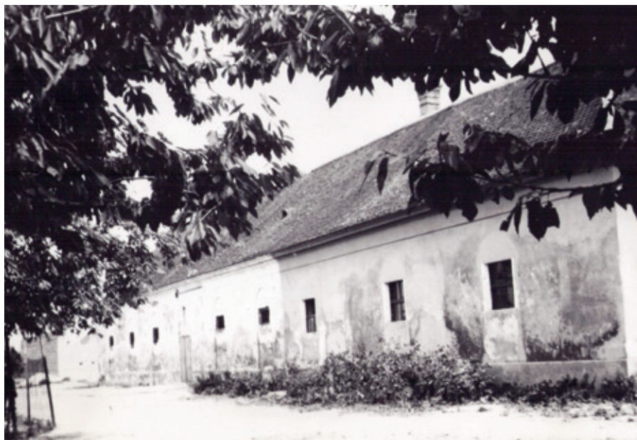
Maštal pre dobytok v bývalom panskom pivovare.

V obci boli aj kozy. Hoci sa každý občan na kozy sťažoval, lebo kozy boli veľkými ničiteľmi stromov, vždy boli na každom dvore. Určite by vraj bolo v dedine viac stromov, nebyť kôz. Kozy sa tiež vyhánali do spoločného stáda so sviňami na pastvu. Z hydiny sa v obci chovali husi, ktoré boli našou domácou rasou. Krdle husí držali pri domoch všetci. V letných mesiacoch bolo ich pasenie zamestnaním detí. Z jari sa pásli vždy na trávnikoch po brehoch Čiernej vody a tiež na spoločnom pasienku v Hájku. V čase žatvy sa pásli po strniskách až do jesene. Po žatve sa raz a niekedy i dvakrát šklbali z peria. Perie sa uschovalo a v zime po dlhých večeroch sa driapalo (zbavovalo ostrých stopiek). Driapanie peria patrilo k veselým zimným prácam žien a dievčat. Priateľky a príbuzné chodili od jednej k druhej si vypomáhať a na driapačky chodili i mláďenci. Ich úlohou bolo zabávať, rozprávať rozprávky, čítať z kníh. Medzitým dievčatá spievali a žartovali. Po skončení