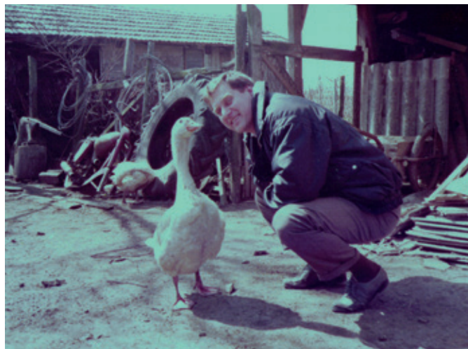
Zvieratá boli doslova členmi rodiny.