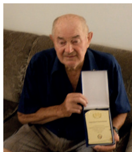
V roku 2015 získal jedno z najvyšších ocenení BFZ, zlatú plaketu.

Samozrejme jeho najväčšia zásluha na rozvoji obce sa udiala v období pôsobenia na poste verejného činiteľa ako tajomníka MNV a neskôr starostu obce do roku 2002. Za jeho pôsobnosti vo funkcii predsedu MNV a po roku 1989 starostu obce sa vybudoval napríklad obecný vodovod, plynovod, dokončil sa Dom smútku, Dom služieb, previedlo sa oplotenie cintorína, vybudovali sa komunikácie, postavila sa nová materská škola, rozšírila sa verejná zeleň. Stále aktuálnym odkazom pre našich spoluobčanov sú aj jeho slová: „ Ludia sa príliš uzatvárajú do svojho súkromia bez záujmu o veci verejné, hoci tie sa ich bytostne