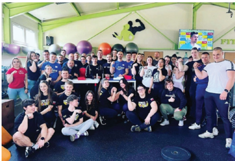
Po majstrovskom záporení.