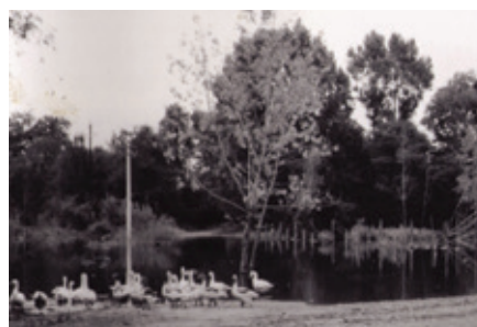
Krdel husí na brehu Čiernej vody.