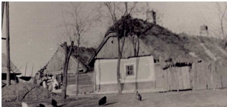
Pohľad na našu obec pred 100 rokmi.

cov. Zvykom bolo, že jednajúci pridával na cene tleskaním do dlane a po dojednaní sa, podali si ruky so slovami „Požehnaj Pán Boh“. Pri dojednaní sa vždy určila cena dobytku, odmena za dochovanie pohoničovi, čo sa nazývalo „ocasné“, alebo „rohové“. Ďalej sa dojednálo kto koľko litrov vína bude platiť oldomáš. Podanie ruky bolo znakom, že dojednanie sa stalo záväzným pre obidve strany. Po tomto dal kupec predávajúcemu istý obnos peňazí ako predavok. Predávajúci zase kupcovi odovzdal dobytčí pas predávaného zvierata. Od toho momentu boli obidve strany povinné dohodu dodržať aj keby sa objavila dosiaľ nezbadaná telesná chyba u zvierata. Bolo zvykom, že od dohody sa dalo odstúpiť iba v prípade, keď odstupujúci zaplatil dvojnásobnú výšku zálohy.