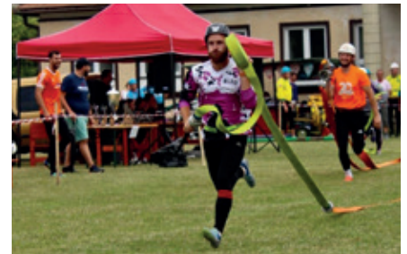
Súťažné družstvo našich mužov.

Po prvý krát sme kategorizovali našu súťaž na šport a klasik. Spomenieme len