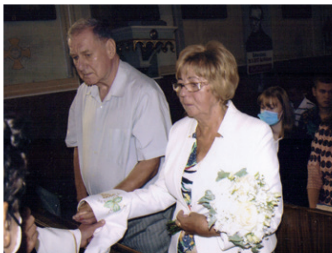
Zlatá svatba, obnovenie manželského sľubu.