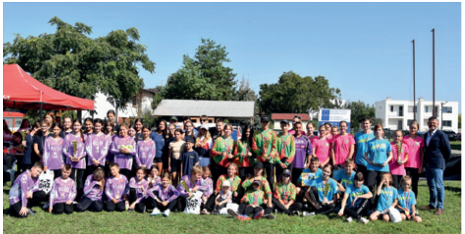
Hasičská súťaž mládeže počas Kráľovskej slávnosti.

V ten istý deň poobede, len čo sme spratili ihrisko, nás s mužmi čakala súťaž v susednej Réci. Sem sme naozaj len odbehli, pretože hneď sme pokračovali v ceste do družobnej obce Batizovce, kde sa 10. 9. konala ich spomienková súťaž a to už 40. ročník. Jedna časť našich členov však ostala doma, aby mohli na obecných osla-