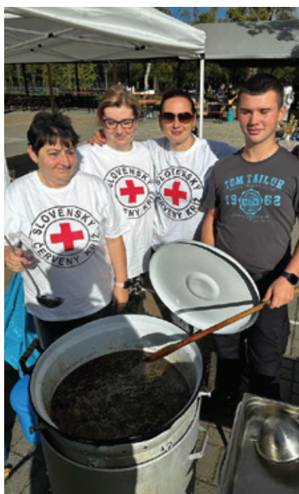
Varenie gulášu na Gastrofeste.

Druhý polrok nášho MS SČK bol veľmi bohatý na činnosti. Tri mesiace- teda júl, august a september, každý piatok sme boli v Hrubej Borši pri premietaní filmov, ako zdravotná služba. 9.septembra sme mali tretí odber krvi MOJKOU, ktorého sa zúčastnilo 31 darcov. Všetkým zo srdca ďakujeme. V ten istý deň sme boli na športových hrach v Hrubej Borši, čo dopadlo na výbornú a bez úrazu. Cez druhý septembrový víkend sa konala trojdňová Kráľovská slávnosť, kde sme zabezpečovali zdravotný dozor. Riešili sme drobné poranenia, ale aj trochu náročnejšie zdravotné zákroky v spolupráci s DHZ. Všetko však dopadlo dobre. Jablkové hodovanie na Si-gotke sa konalo 16. septembra a bolo nao-