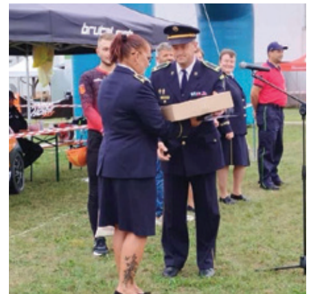
Odvzdávanie ocenení počas Kráľovského pohára.

prvé miesta v kategórii šport. Mužskú kategóriu vyhral DHZ Hoština, klasika muží DHZ Brestovany. Ženskú kategóriu šport DHZ Dvorníky a ženy klasika DHZ Reca. Losovačku vyhral DHZ Šenkvice. Sprievodných podujatí behom dňa bolo opäť neúrekom: cukríky z neba /jeden si našiel letenku/, maľovanie na tvár, tvorivé dielničky, ochutnávka vína, predajné stánky, a večer sa uskutočnil koncert skupiny AC DC revival. Po ich vystúpení sme mali možnosť užiť si pár skladieb chlapcov z Batizoviec v sprievode heligónky. Atmosféra počas podujatia bola neopísateľná a budeme radi ak nás svojou účasťou