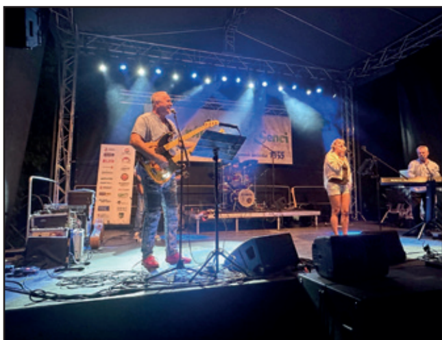
Na Kráľovskej slávnosti bolo veselo