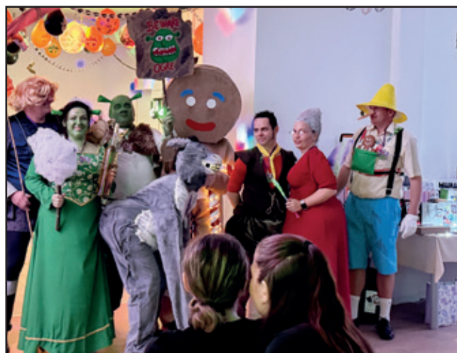
Vitazná maska na halloweenskej zábave