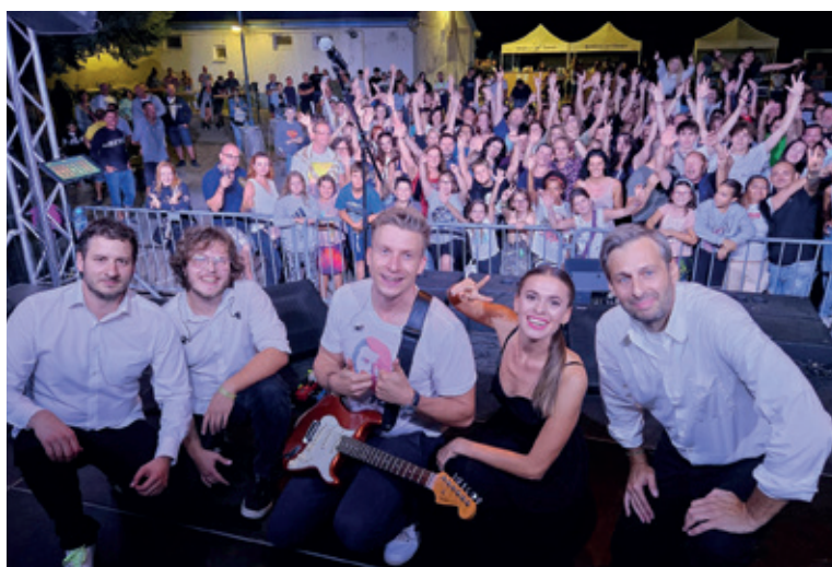
V programe vystúpil aj známy herec, spevák, moderátor Juraj Bača