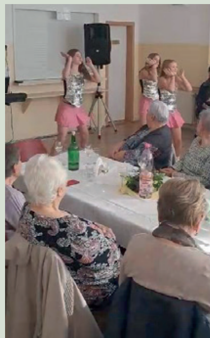
Vystúpenie tanečného súboru pri príležitosti Mesiaca úcty k starším.

Na záver sa chcem poďakovať starostovi obce a pracovníkom obecné-