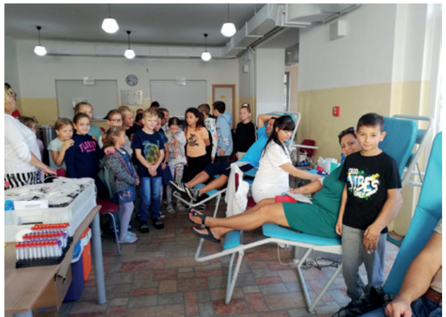
V materskej škole v Hrubej Borši

vých priestorov, ktoré nám poskytla obec v budove hasičskej zbrojnice. Máme krásnu miestnosť, veľkú, dôstojnú, vymalovanú s novým osvetlením aj podlahou. Už je to teraz v našich rukách, aby sme z nej spravili priestor aj pre vaše návštevy.