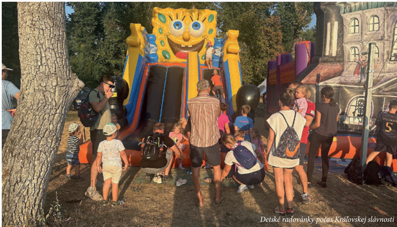
Detské radovánky počas Kráľovskej slávnosti