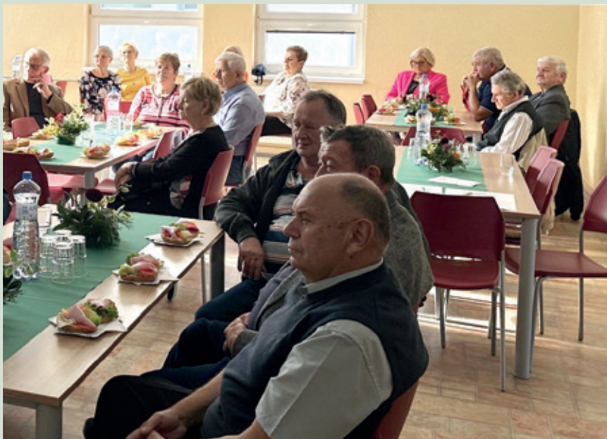
Na výročnej členskej schôdzi Jednoty dôchodcov.