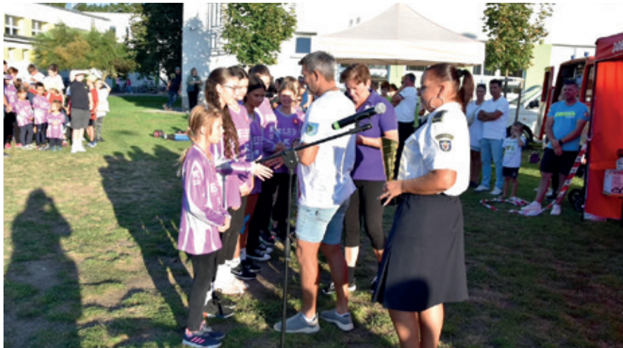
Starosta obce a predsedníčka DHZ odovzdávajú cenu víťaznému družstvu.

Rovnako zabezpečujeme aj hliadky, či už počas obecných osláv, alebo teraz, ku koncu roka na včelárskej paseke, kde sa konali v dňoch 27.12., 30.12. a 4.1. živé jasličky komunitného centra Cenacolo.