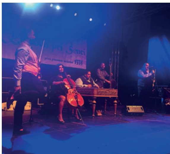
Vystúpenie hudobnej skupiny "Cigánski diabli"