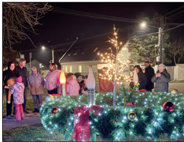
Pri adventnom venci