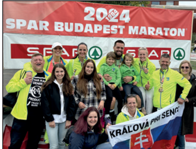
Na maratón v Budapešti