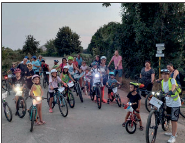
Nočné cyklojazdy v Kráľovej pri Senci