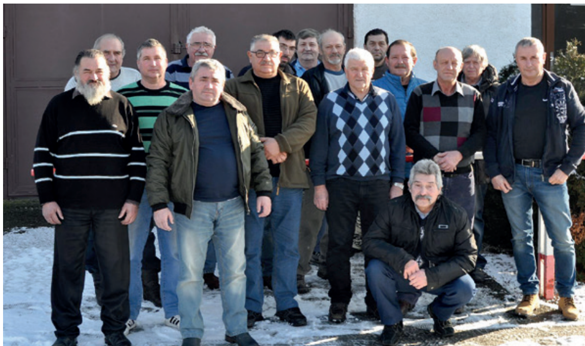
Členovia miestneho spolku holubárov z nedávnej minulosti