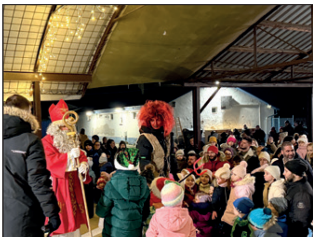
Mikuláš na Sigoťke