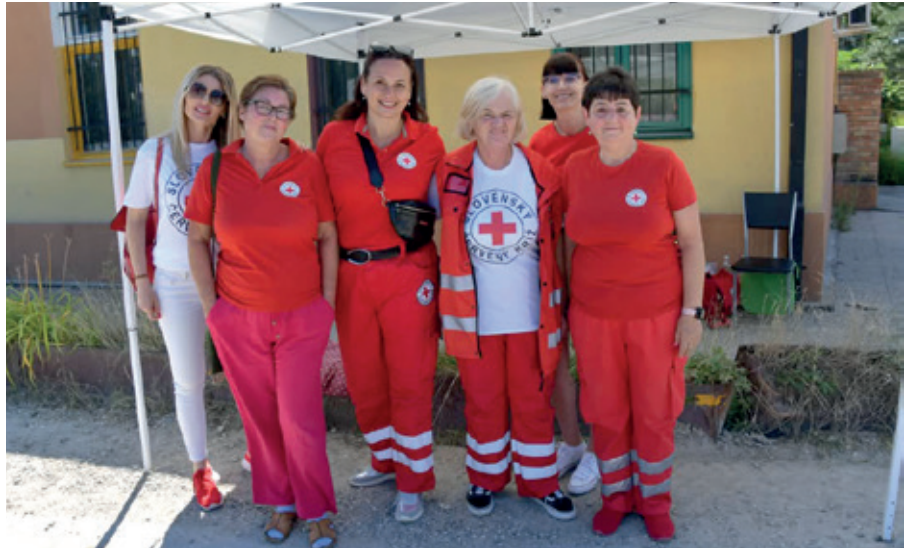
Zdravotná hliadka na Kráľovskom pohári hasičov