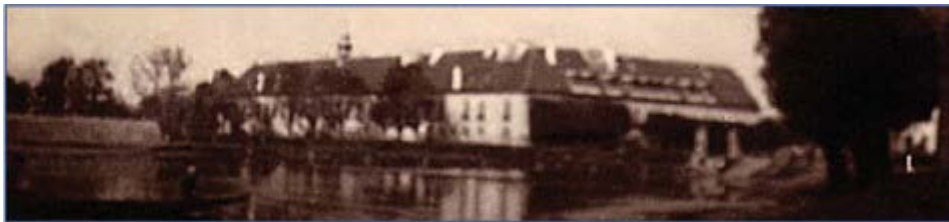
Pôvodný kaštieľ rodu Pálffyovcov (fotografia z roku 1935)

nám objavujú aj ďalšie modifikácie tohto názvu ako Körmesd, Kurmusd, Pap Körmösd, Kermežd, až po miestne pomenovanie Kermeš a pomenovanie obce z 20. storočia - Krmeš. Názvoslovie Kráľovej sa nám začína v písomných prameňoch objavovať v 14. storočí. V blízkosti obcí Kráľová a Krmeš sa nachádzali aj dnes už zaniknuté osady villa Leopoldi (osada Leopolda) a Bothszegh (Botseg, Bosek). Samotné pomenovanie obce Krmeš vzniklo v prvom rade z pomenovania majetku cirkevnej správy. Toto dvojslabičné slovo má základ v staroslovanskom slove mežda (medza, chotár). Ohraničenie majetku bolo podľa metácie určovania a vytyčovania chotárnych hraníc vykonané v podobe kruhu, V názve obce možno vidieť predponovaný tvar kruh, kor, ker. Zúžením slova kruhmežda vzniklo postupným vývojom vlastné pomenovanie Kruhmežd, Kermežd, Krmeš. Pomenovanie Dijáki sa viaže na slovo diák - žiak. Takéto pomenovanie vyplynulo z určenia majetku bratislavskej kapitule na výchovu kňazského dorastu, čiže z ohraničenia majetku, z ktorého bola vydržiavaná cirkevná škola alebo nejaká iná cirkevná inštitúcia kapituly.